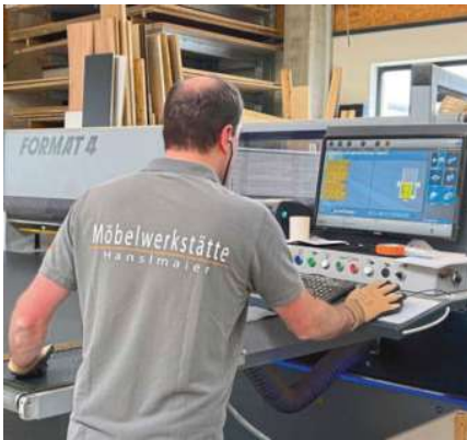
/ Das ergonomisch designte Bedienpult der Plattensäge verfügt über einen 24" großen Monitor.