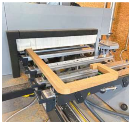
/ Die Profit H 350 ist zentraler Dreh- und Angelpunkt in der leistungsstarken Schreinerei. Die 5-Achs-CNC ...