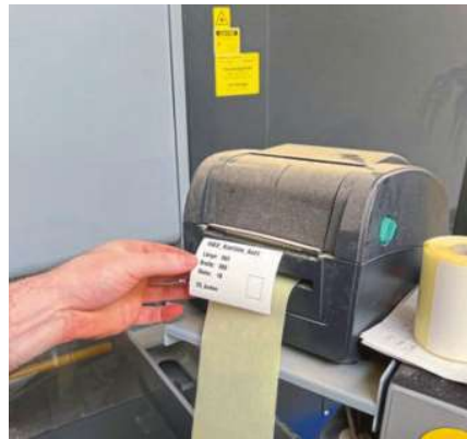
/ Direkt an der Säge werden die Etiketten ausgedruckt und auf die zugeschnittenen Teile geklebt.

führen. Und unser 5-Achs-CNC-Bearbeitungszentrum versetzt uns in die Lage, unterschiedlichste Lohnarbeiten zuverlässig, präzise und schnell zu erledigen. Kollegen ordern bei uns aber durchaus auch regelmäßig größere Stückzahlen montagefertige Korpusse.“