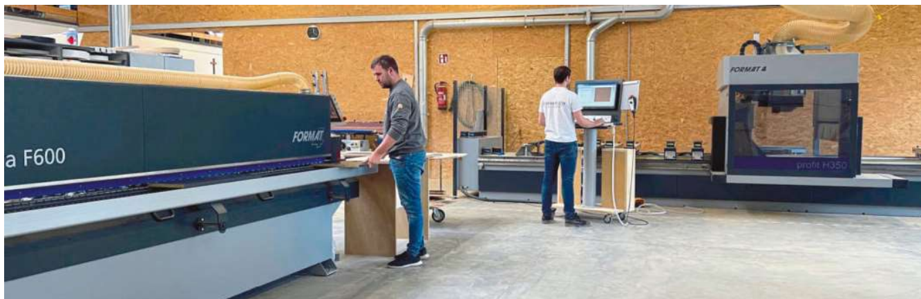
/ Die voll gesteuerte Tempora-Kantenanleimmaschine ist seit inzwischen zwei Jahren im Einsatz und hat seitdem sehr viele Laufmeter Kanten angefahren. Sie ist räumlich optimal zum CNC-Bearbeitungszentrum aufgestellt.