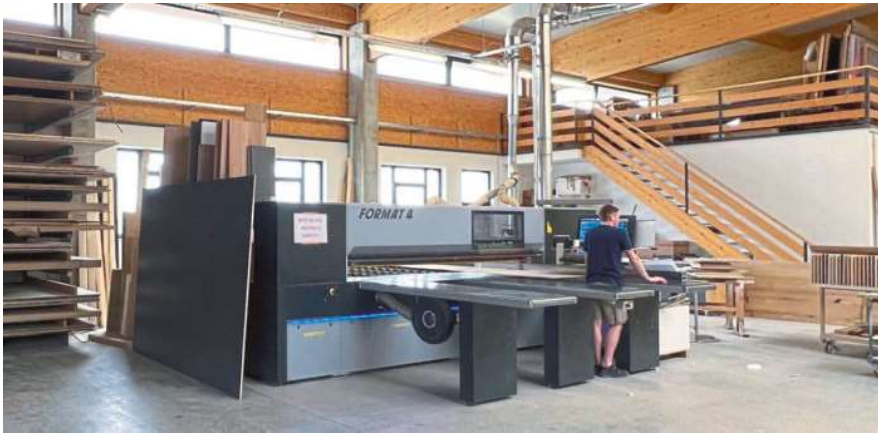
/ Da geht richtig was: Der Plattenzuschnitt erfolgt in der Schreinerei auf einer liegenden Plattensäge vom Typ Format 4 Kappa Automatic 80.