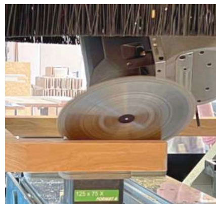
/ ... wird als hochflexibles Multitalent für unterschiedlichste Bearbeitungsaufgaben eingesetzt.

terial realisiert haben. Zum Großteil arbeitet das Unternehmen mit Architekten zusammen. Hier geht es von Hotels über komplette Innenausbauten bis hin zu anspruchsvollen Yacht-Ausbauten. Weitere wichtige Bereiche sind Objekteinrichtungen, Gastronomie- und Hotelausstattungen oder auch Messestände für gewerbliche Kunden. Und selbstverständlich ist für Hanslmaier auch das Privatkundengeschäft sehr wichtig. Hier ist man ebenfalls sehr breit aufgestellt und bietet das volle Programm bis hin zu Küchen, Bädern, Treppen und Türen sowie natürlich exklusiven Einzelmöbeln.